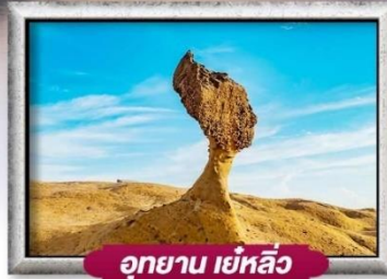
อุทยาน เย่หลิว