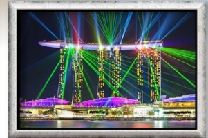
Wonder Full Light & Water Spectacular