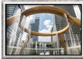
Fountain of Wealth