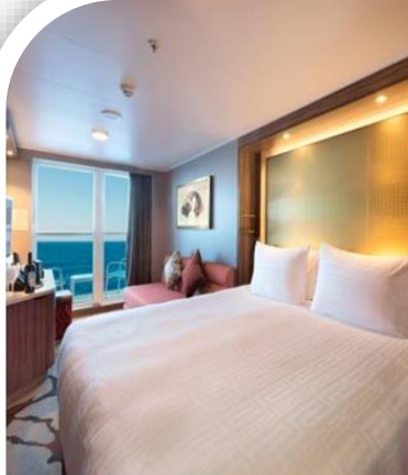
Oceanview Stateroom with Balcony