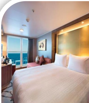
Oceanview Stateroom with Balcony