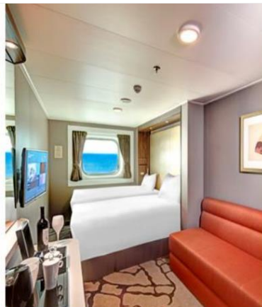
Oceanview Stateroom with Window